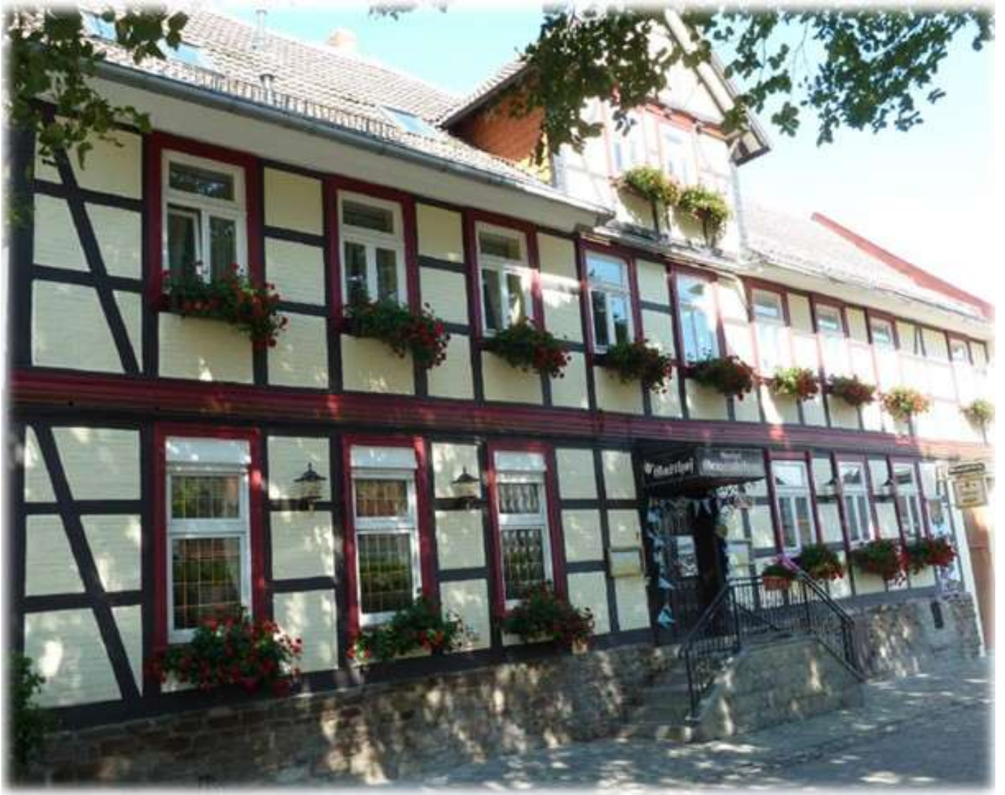
Ansicht des Gemeindekrugs von 2007

Aufgearbeitet von der Chronikgruppe des Heimatvereins „Wei Drübschen“ e.V. (2024)