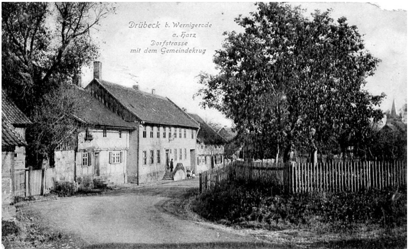
Die Dorfstraße mit Blick auf 2 Wohnhäuser – in der Mitte der Gemeindekrug 1906