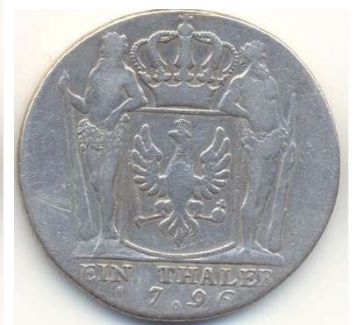
und der Thaler