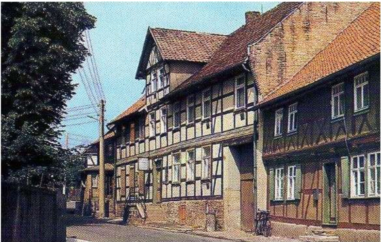
Der Gemeindekrug um 1982 - Dorfstraße