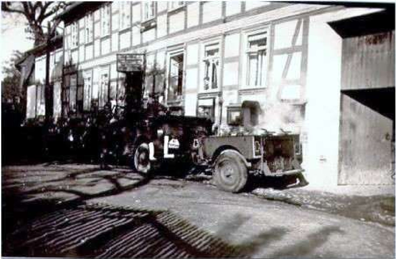
Militärfahrzeug mit Anhänger vor dem Gemeindekrug 1945