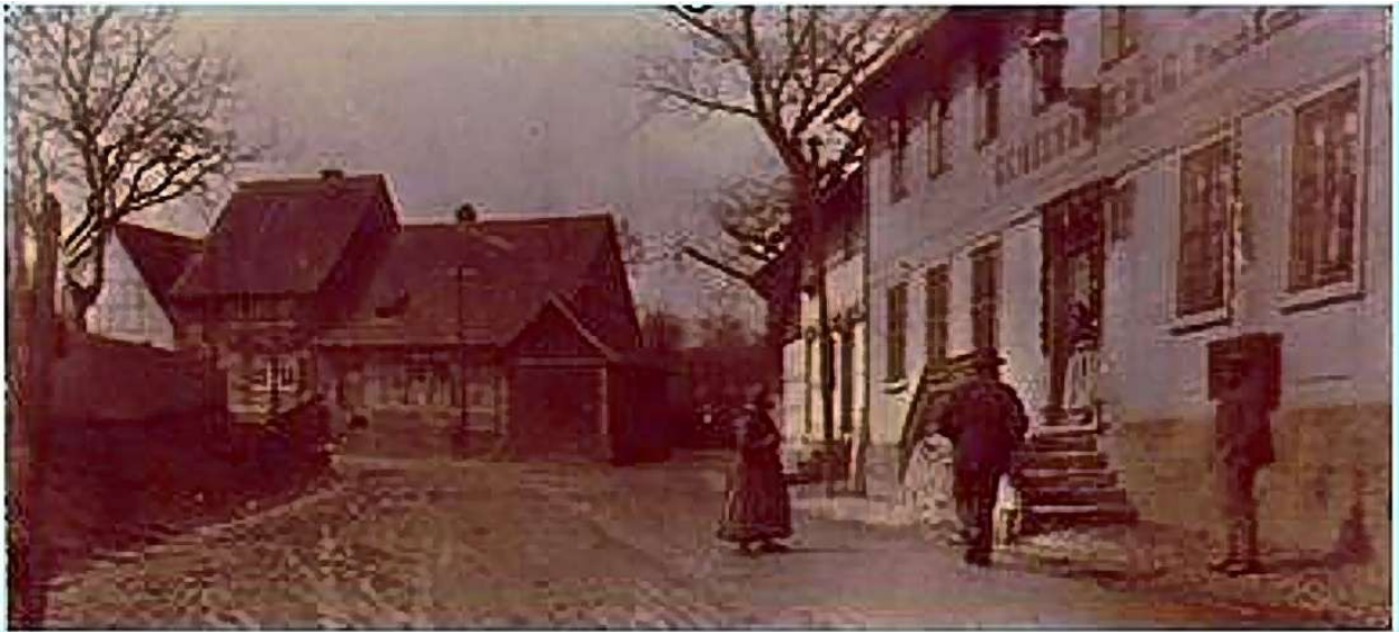
Der „Gemeindekrug“ um 1900