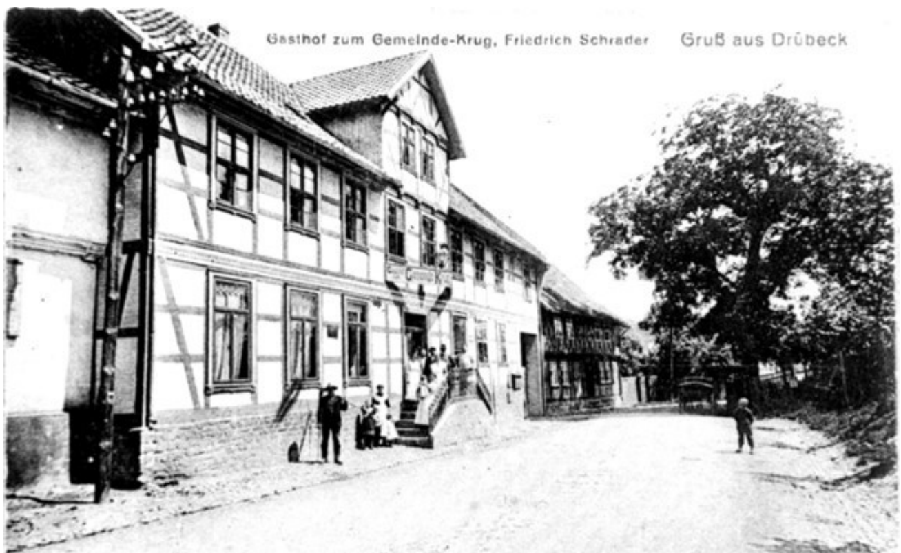
Der Gemeindekrug 1937